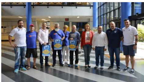
Imaxe da presentación este venres da cita.

Economistas académicos, investigadores e estudantes de doutoramento que traballan en cuestións enerxéticas e ambientais, participarán os días 21 e 22 de xuño na oitava edición do Atlantic Workshop on Energy and Environmental Economics (AWEEE), que se celebrará na Toxa. Organizadas por Economics for Energy, as sesións reunirán arredor de 60 especialistas. +Info.