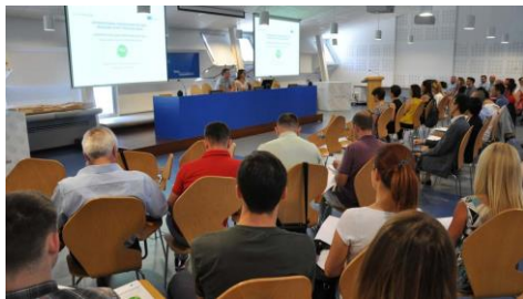
As e os participantes proceden dos Balcáns, China, Turquía, Portugal e Italia.