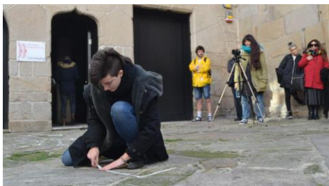
Unha das performances que formaron parte do programa de anterior edición.