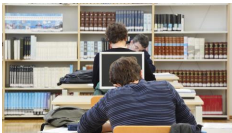
O prazo remata o 29 de xuño.