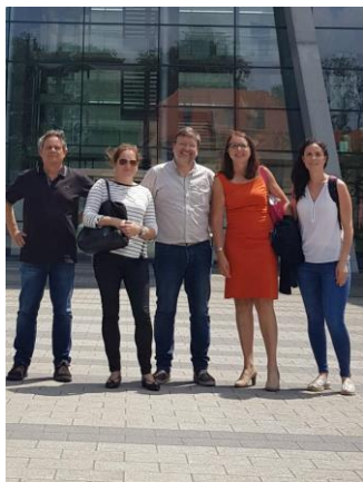
O profesorado da EE Forestal, xunto aos representantes da Universidade de Ciencias Aplicadas de Salzburgo.