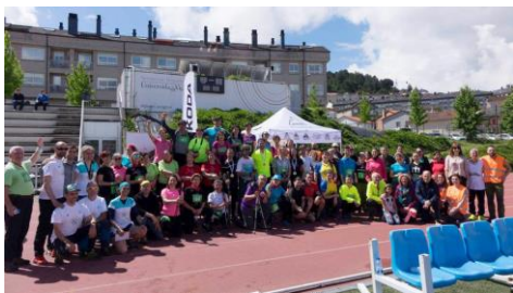
I Open de Marcha Nórdica Campus da Auga-Cidade de Ourense.