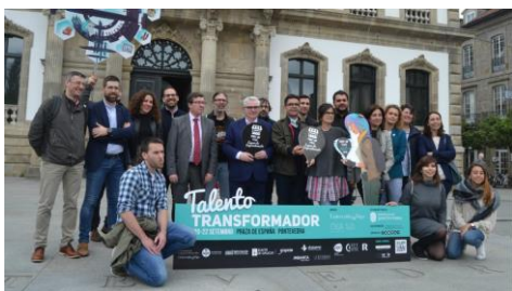
Foto de familia de organizadores, patrocinadores e participantes en anteriores edicións do Pont_up Store.

Doce exemplares de cabalo galego do monte, un macho, nove eguas e dous poldros, doados por gandeiros e propietarios forestais do municipio de Cerdedo-Cotobade, foron trasladados e soltados na tarde do luns nunha parcela pechada de 100 hectáreas xestionada pola Comunidade de Montes Veciñais en Man Común de Estacas, no concello de Fornelos de Montes. Esta solta insírese nas actividades derivadas do proxecto de investigación Estudo e conservación do Cabalo Galego do Monte a través de acordos de custodia do territorio , +Info.