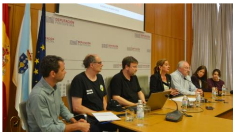
O Pazo Provincial acolleu a presentación desta cartografía.

Un dos mitos recollidos polo poeta Ovidio na súa obra Metamorfoses relata como o deus Baco foi secuestrado por un grupo de piratas que non o recoñeceron e como este deus como castigo os transforma en golfinhos, coa excepción de Acetes, que si se decatara de quen era e tentara disuadir aos seus compañeiros. Este é o fío condutor de La existencia de Acetes , a exposición comisariada polo italiano Stefano Spairani Righi que ata o 30 de xuño pode visitarse na Casa das Campás e que reúne obras de sete artistas españois e italianos. +Info.