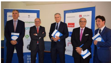
Este xoves presentou na Coruña o seu Anuario 2018.