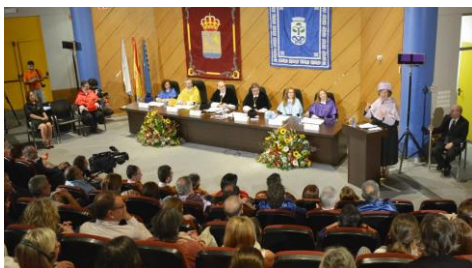
A profesora norteamericana foi investida este mércores doutora honoris causa.

O campus de Ourense presentou este martes o que será o V Torneo Internacional de Xadrez Campus de Ourense , unha cita que se presenta renovada en formato co obxectivo de ser máis dinámica e participativa. Nesta edición, a competición, que se desenvolverá os días 30 de xuño e 1 de xullo no pavillón de deportes universitario, contará con dúas modalidades de xadrez, as modalidades rápida e lóstrego. +Info.