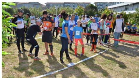
Imaxe das corredoras e corredores na anterior edición celebrada en Monteferro, Nigrán.

O estudo sobre o proceso de descomposición das follas, realizado por alumnado do CEIP Froebel, a análise dos datos de peso, altura e índice de masa corporal que estudantes do CEIP Vilaverde realizaron dos seus 300 compañeiros e compañeiras co propósito de poñelo en relación co tipo de alimentos que compoñen as súas merendas, xunto aos experimentos realizados polos nenos e nenas do CEIP Sagrado Corazón de Placeres sobre como o aumento da temperatura ambiente inflúe na temperatura do mar ou o estudo sobre o proceso de conservación dos alimentos do CEIP Marcón. +Info