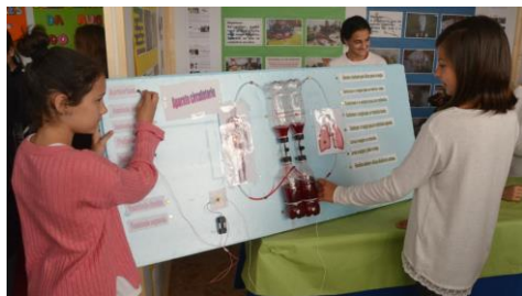
Dúas alumnas do CEIP San Martiño, co seu experimento do aparato circulatorio.