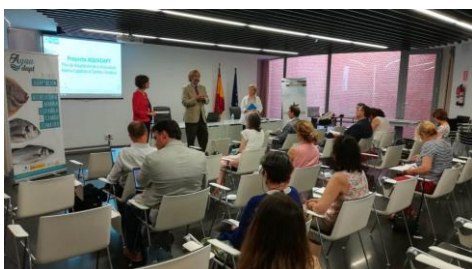
Imaxe da apertura oficial da xornada na Secretaría General de pesca...