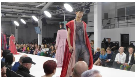
Esdemga estivo representada neste evento pola colección gañadora de Debut 2017.

51 universidades e escolas de moda de 21 países estiveron representadas este mércores na pasarela internacional da 27 edición da Graduate Fashion Week , o evento no que máis dun milleiro de estudantes e graduados e graduadas das principais universidades e escolas británicas presentan os seus proxectos e que se completa cun desfile internacional na que a Universidade de Vigo volveu ser, por segundo ano consecutivo, a única representante española. +Info