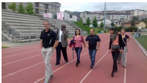
Imaxe da visita.

Dotar ao tecido empresarial galego de persoal con formación superior que poida xestionar e coordinar todas as actividades no ámbito medioambiental nas instalacións industriais e facelo dentro dun marco legal cada vez máis responsable coa contorna, a saúde pública e os ecosistemas. Este é o obxectivo co que nace o Máster en Xestión Ambiental da Industria , unha nova proposta formativa que nace na Escola de Enxeñaría Industrial froito da unión entre profesores e investigadores de diferentes ámbitos e profesionais con experiencia en medio ambiente e xestión ambiental dos principais sectores industriais de Galicia. +Info.