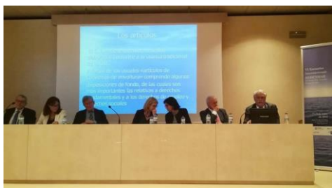
O Museo do Mar acolle o workshop da Rede de Excelcia de Estudos Xurídicos Marítimos.