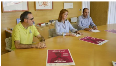
A cita terá lugar os días 30 de xuño e 1 de xullo.