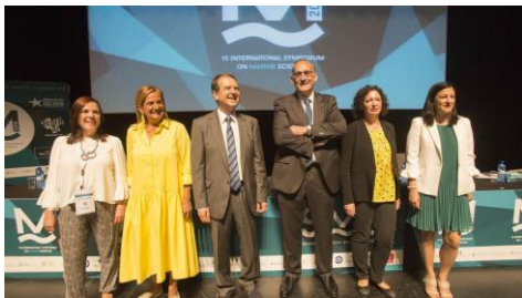
O VI Internacional Symposium on Marine Sciences arranca en Vigo..