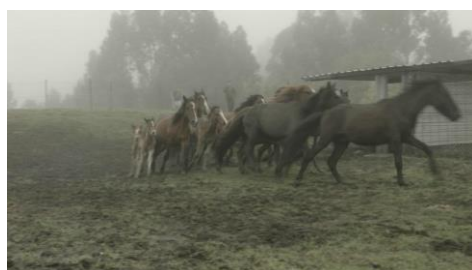
Unha das imaxes tomadas polo grupo Sepcom da solta realizada en Estacas.