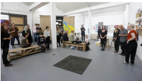
Un intre da inauguración de "Actitud".

Froito da colaboración entre a Universidade de Vigo, o Consello Social da Universidade de Vigo e a Deputación de Ourense vén de abrirse unha nova edición da convocatoria de Bolsas Ourense Exterior . Nesta ocasión son cinco as prazas que se ofrecen para que residentes no estranxeiro poidan realizar un mestrado no campus de Ourense. As bolsas cobren as taxas de matrícula; unha axuda de 600 euros para gastos de viaxe e outra de 2500 euros para gastos de aloxamento. +Info