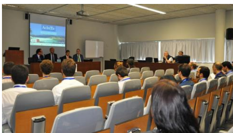
Inauguración das xornadas no salón de graos da EE de Telecomunicación.

Este xoves remata o prazo para presentar as solicitudes da convocatoria para a organización de eventos e actividades con perspectiva de xénero . Trátase dunha iniciativa que trata de fomentar entre a comunidade universitaria a celebración de conferencias, xornadas, exposicións ou outro tipo de actividades que teñan como finalidade contribuír á sensibilización en materia de xénero e fomenten a transmisión de valores igualitarios. +Info.