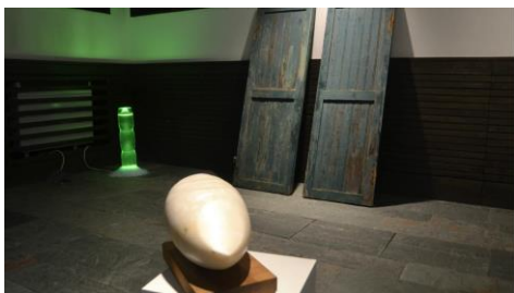
Unha exposición reúne obras de artistas españois e italianos en torno a Metamorfoses de Ovidio.